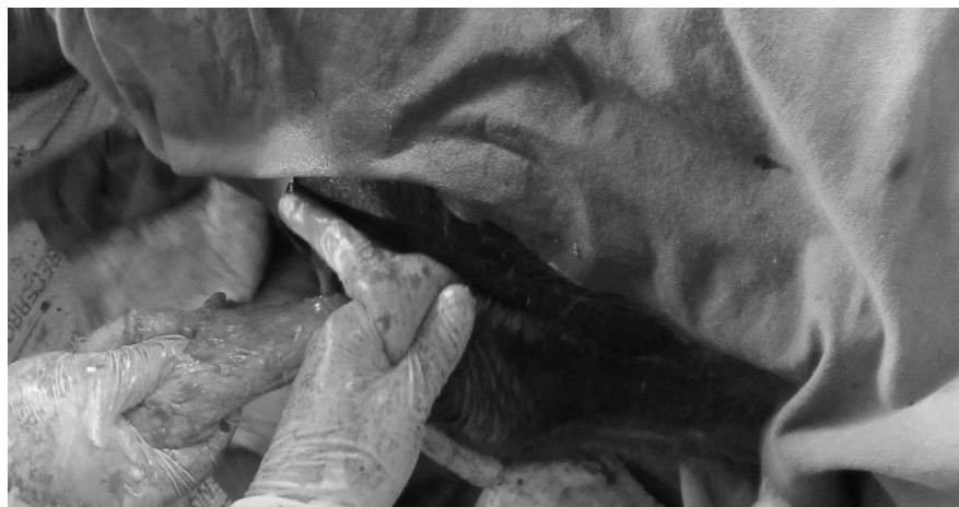
Figura 3. Desbridación y disección del forro en 2/3 de su longitud.

Posteriormente se procedió a desbridar el plano subcutáneo, utilizando tijeras de punta roma en dirección oblicua, esto es en el ángulo aproximado de desviación ( 45^{\circ} ); una vez desbridado, se deslizó el forro junto con la porción cutánea del prepucio, cuidando que no existieran torsiones (Figura 4).