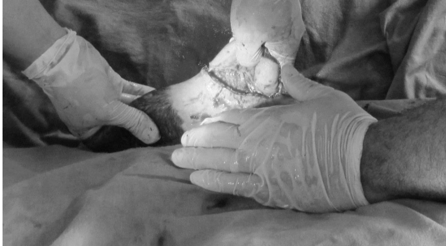
Figura 2. Disección de meato prepucial.