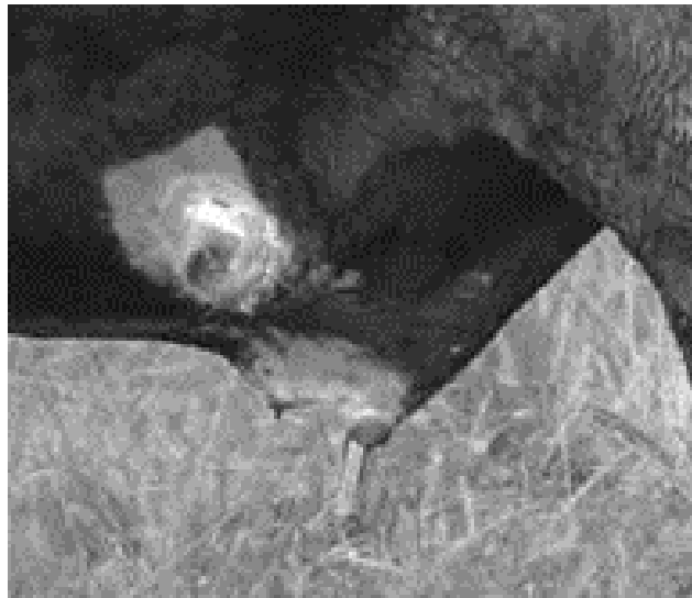
Figura 6. Cirugía terminada con colocación del dren y sutura con puntos en "U".