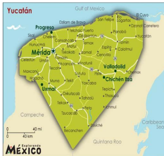
Figura 1. Ubicación del municipio de Yaxcabá en Yucatán.

El estudio se realizó en dos granjas de ovinos ubicadas en el municipio de Yaxcabá, Yucatán, México. Yaxcabá es uno de los 106 municipios que constituyen el estado de Yucatán. Se localiza en el centro del estado entre las coordenadas geográficas 20° 12' y 20° 46' de latitud norte, y 88° 34' y 89° 02' de longitud oeste; a una altitud entre 7 y 10 metros sobre el nivel del mar. El clima es cálido subhúmedo, clasificación Aw 0 (x') (i') g, con lluvias en verano y ligera estacionalidad térmica y pluvial en dos periodos del año (Durán y Méndez, 2010). La Figura 1 muestra la ubicación geográfica del municipio de Yaxcabá en Yucatán, México.