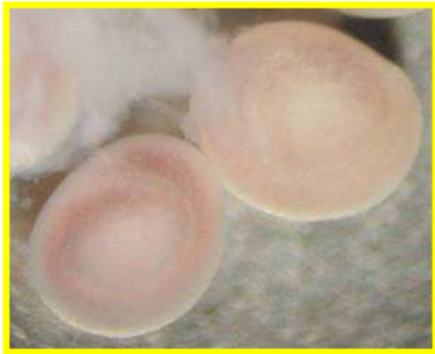
Figura I. quiste larvario

cuticulares en la región anterior fue de 2 a 3 puntas; en la región media y posterior disminuyeron a 2 y 1 punta. La cauda del macho presentó cuatro pares de papilas laterales grandes y cuatro pares más en posición media y un par de espículas desiguales, que se proyectan a través de la cloaca. La vulva en la hembra se localizó en la región media y ventral del cuerpo.