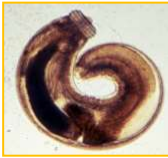
Figura II. larva infectiva L3A