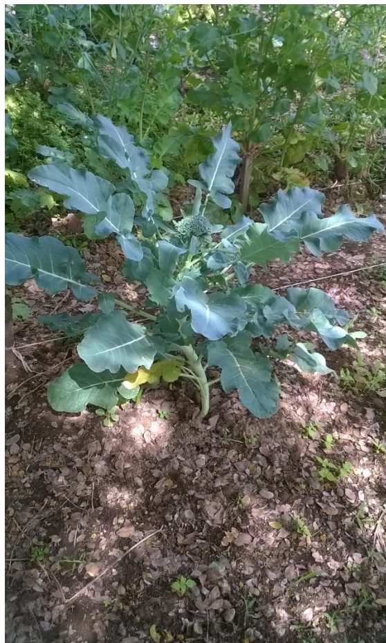
Figura 2. Planta de brócoli

En las figuras 1 y 2 se aprecia del pobre desarrollo de las hortalizas, por ser un suelo podre en MO, presentando bloques compactos.