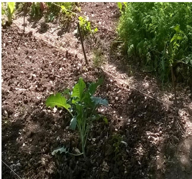
Figura 3. Se observan los bloques

Se determinó la humedad equivalente a la CC, dando valores de 22.3% así como velocidad de infiltración de 12.0 mm/h, la cual puede considerarse como buena, pero a su vez, presentando valores muy bajos de microporosidad, exhibiendo una capa de arcilla que no deja filtrar el agua a capas más profundas del subsuelo.