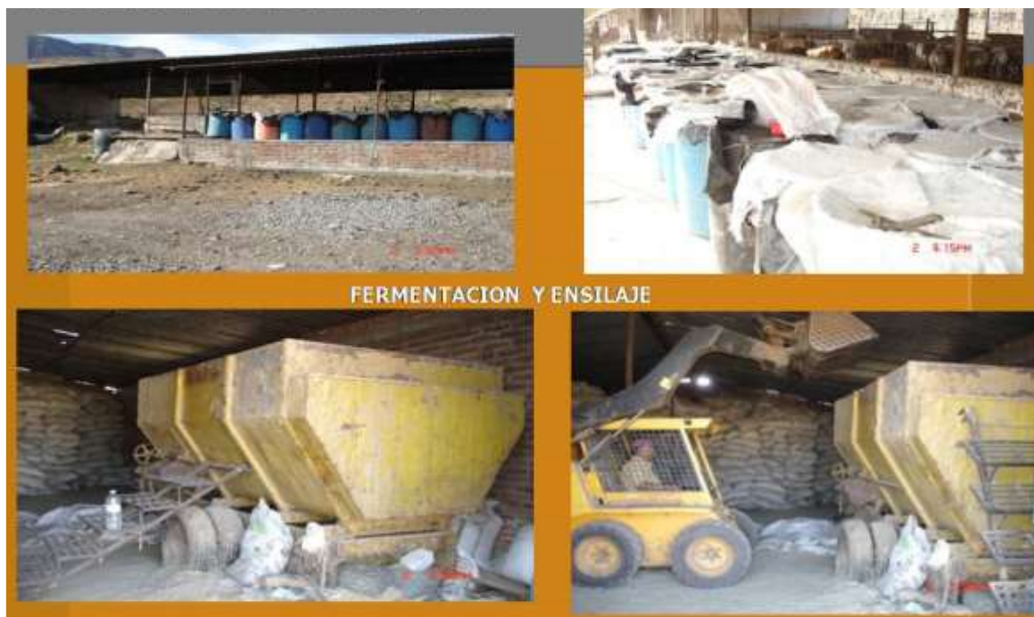
Figura 2. Ensilado y/o fermentación de la cerdaza, además de la inclusión a la revolvedora