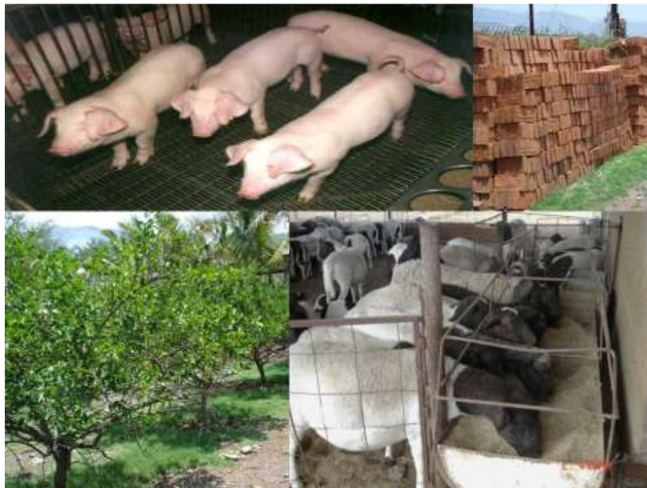
Figura 3. Los cerdos, limones, ladrillos y las borregas consumiendo alimento.

La empresa se considera sustentable al reciclar el agua, usar la cerdaza fermentada como alimento para ovinos y usar el excremento de ovinos como abono y/o en la construcción de ladrillos. La cerdaza es un alimento económico, palatable y nutricional para los ovinos, lo cual hace que sea un alimento de excelente calidad.