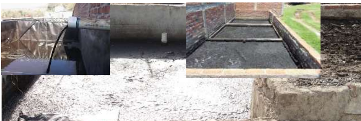
Figura 1. Lagunas facultativas

En las corraletas con piso de cemento, primeramente, se recogió la cerdaza con pala y carretilla, y se llevó al área de ensilaje; las corraletas después se lavaron con agua reciclada, que provenía de lagunas facultativas, ver figura 1.